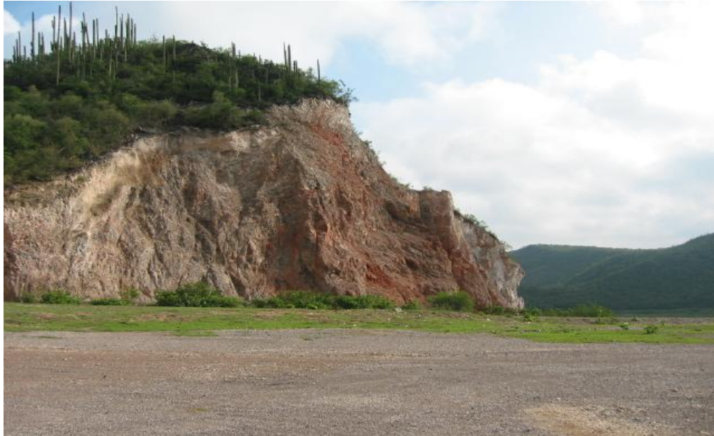
Tajo de materiales de la localidad La Herradura, en la que se producía grava y arena triturada y cribada a partir de caliza.